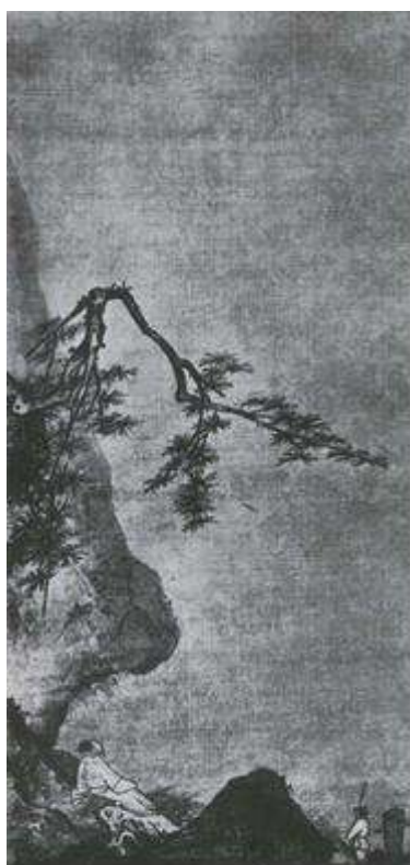
Ма Юань. Лунный свет. Живопись тушью на шелке. XII—XIII вв.